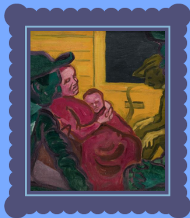
Bohumil Kubišta Cestující třetí třídy