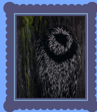
Toyen Hlas lesa