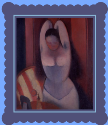
Rudolf Kremlička Česající se žena